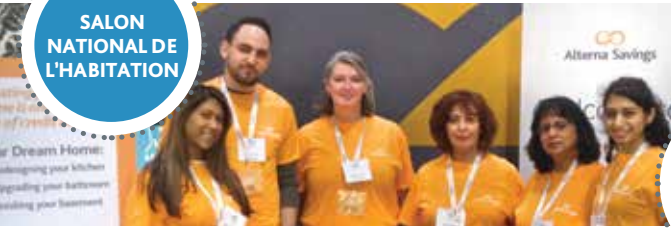
SALON NATIONAL DE L'HABITATION