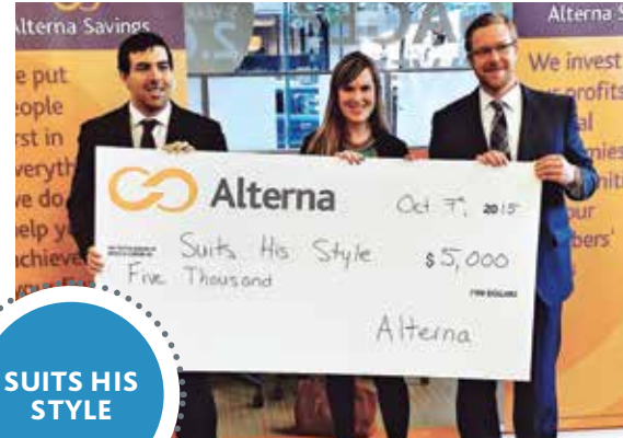
SUITS HIS STYLE

En 2015, Alterna a donné à Suits His Style une subvention communautaire de 5 000 $, qui couvre les frais d'exploitation d'une année complète. Au cours de sa première année d'opération, Suits His Style a habillé 54 hommes. Vingt-six d'entre eux ont trouvé un emploi à temps plein et 10 ont lancé leur propre entreprise ou repris leurs études.