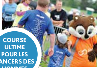
COURSE ULTIME POUR LES CANCERS DES HOMMES