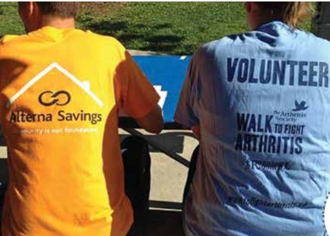
MARCHE CONTRE LA DOULEUR DE LA SOCIÉTÉ DE L'ARTHRITE